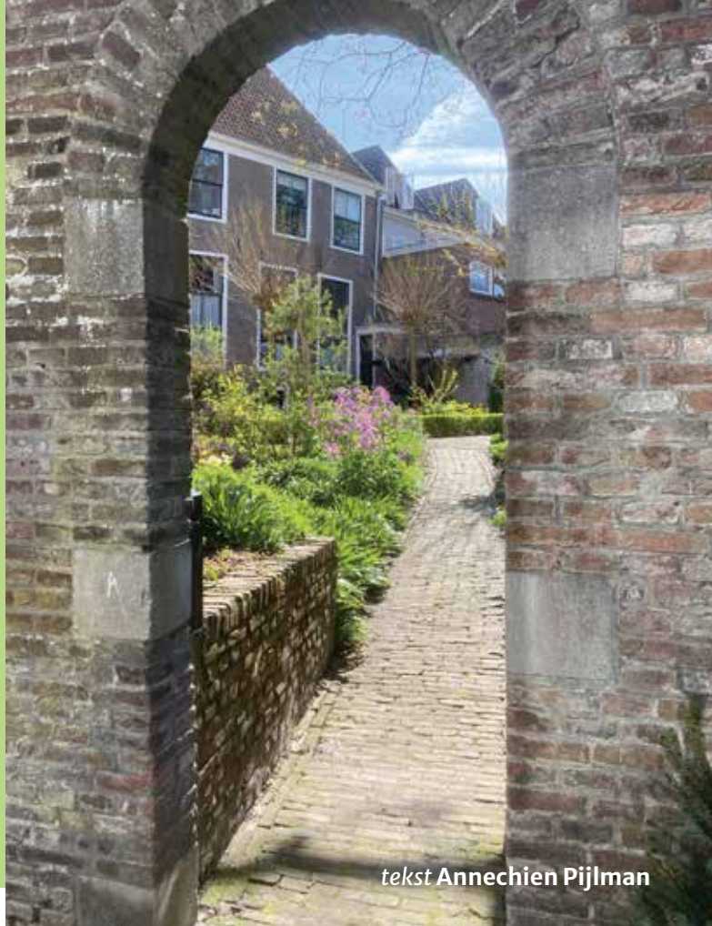
tekst Annechien Pijlman

Met dreigende regenwolken aan de hemel fiets ik naar het Foreestenhuis in Hoorn. Op naar de bijbelse tuin waar ik de tuinpoort ga openen voor onze vrijwilligers.