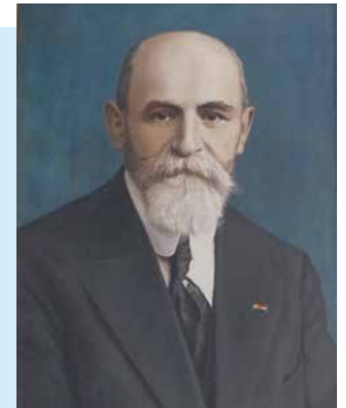
afb. in Doopsgezind Jaarboekje 1931

Voor het Algemeen Handelsblad tekende hij jarenlang bijna iedere week een portret van iemand in het nieuws. Na de Tweede Wereldoorlog, toen het reproduceren van portretfoto's in de media eenvoudiger en minder kostbaar was geworden, liepen de illustratieopdrachten terug.