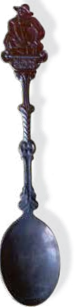
Souvenirlepelkje dat in het Schuilkerkje in Pingjum wordt verkocht

WITMARSUM mag te recht op MENNO SIMONS roemen En Nederland in hem zijn Kerkhervormer noemen Hier was het daar hij stouit het Priesteryuk verbrak En in dit Huisje het eerst naar t'vrij geneten sprak